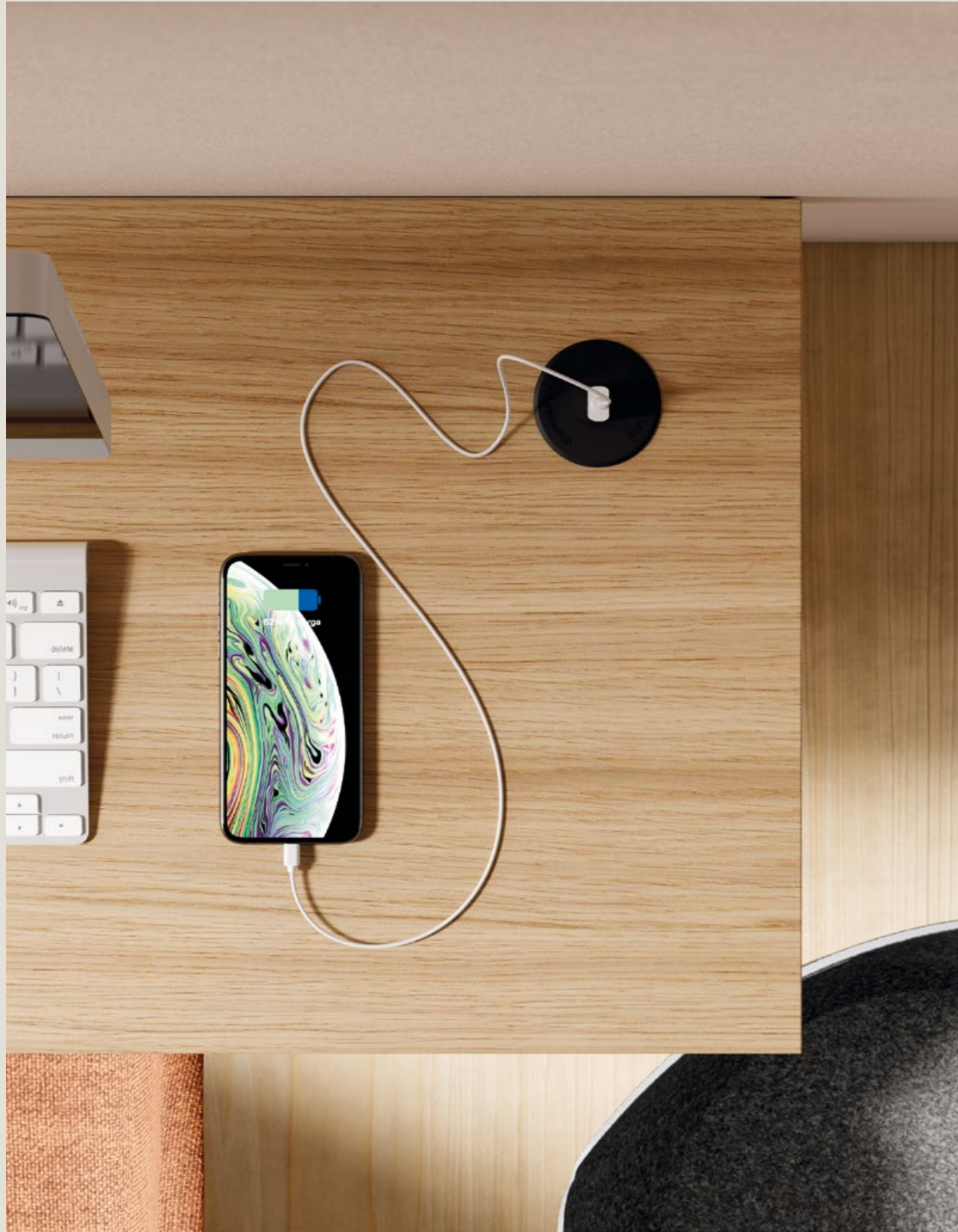
ES_Cargador Cargador de inducción para móvil + USB.