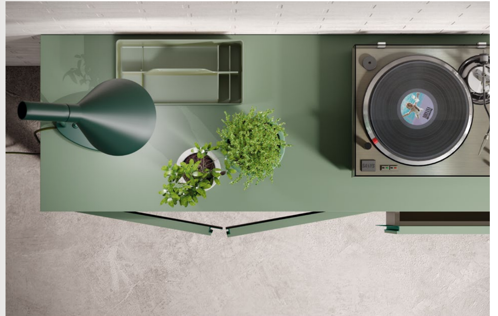
ES_Nuevo tirador L y U EN_New handle L and U FR_Nouveau poignée L et U

ES_ Con formas claras y sencillas. EN_ With clear and simple forms. FR_ Avec des formes claires et simples.