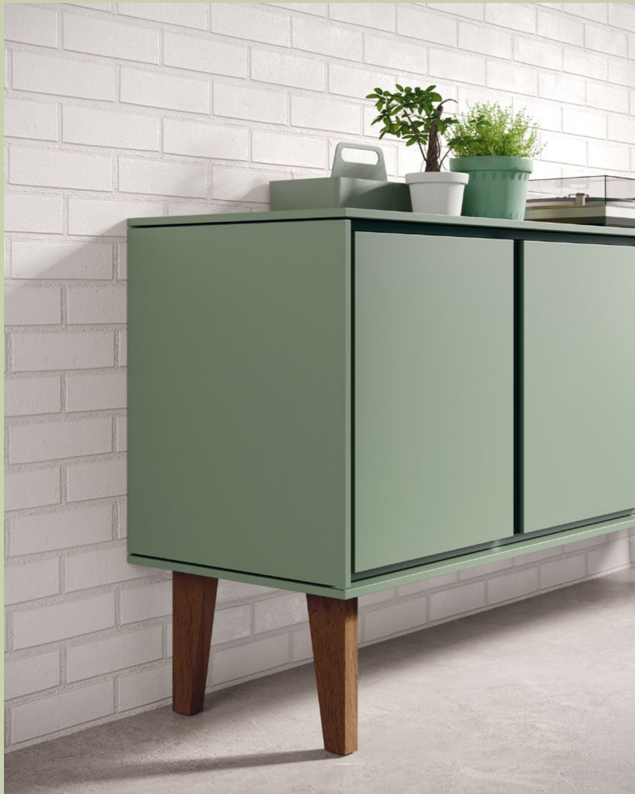
ES_Patas de madera. Book. Altura 25 cm EN_Wooden legs. Book. Height 25 cm FR_Pieds bols. Book. Hauteur 25 cm