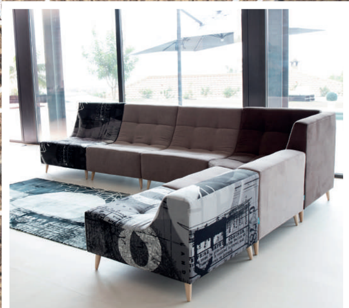
Ex - Mystic 252 - Mystic 144 - Mystic 252 - Ex