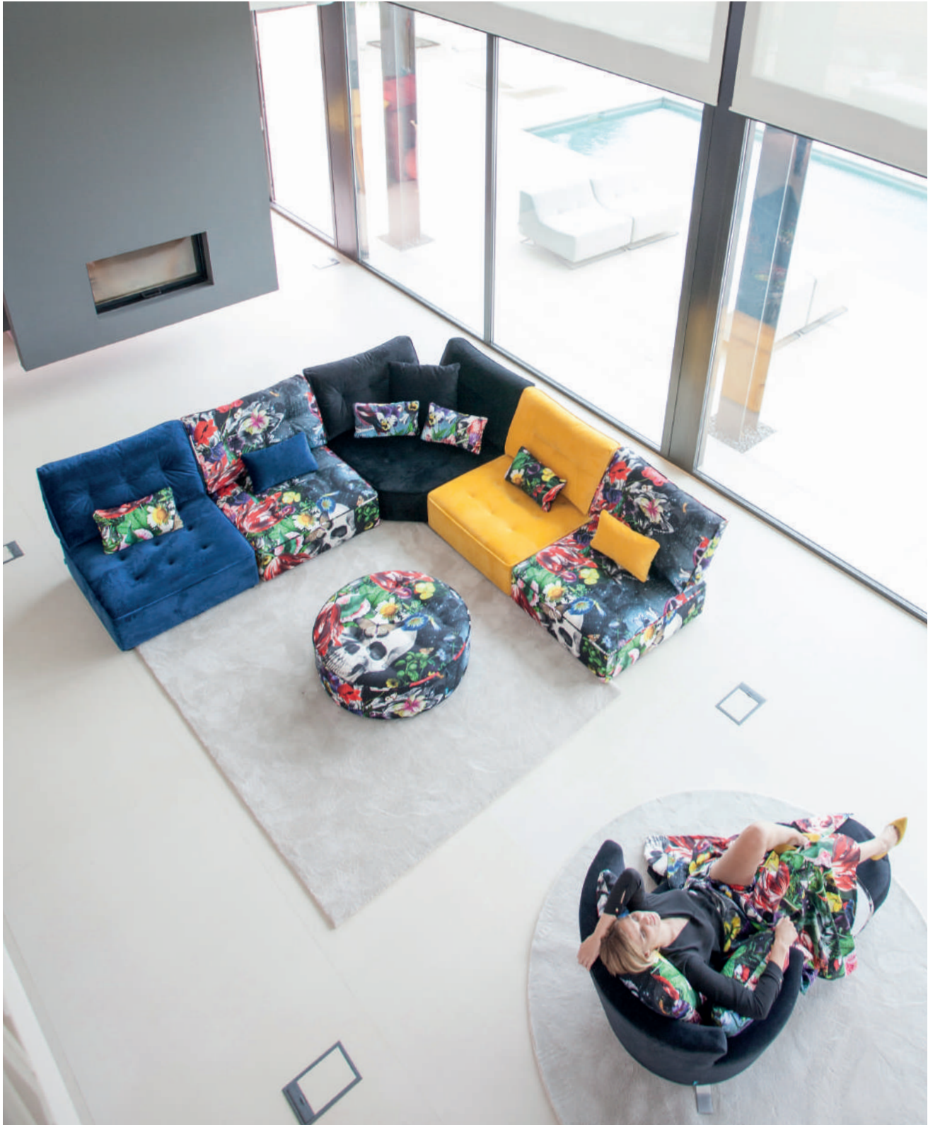
Venice 29 - Supernatural - Venice 32 - Venice 43 - Supernatural / Supernatural / Club 55 - Supernatural