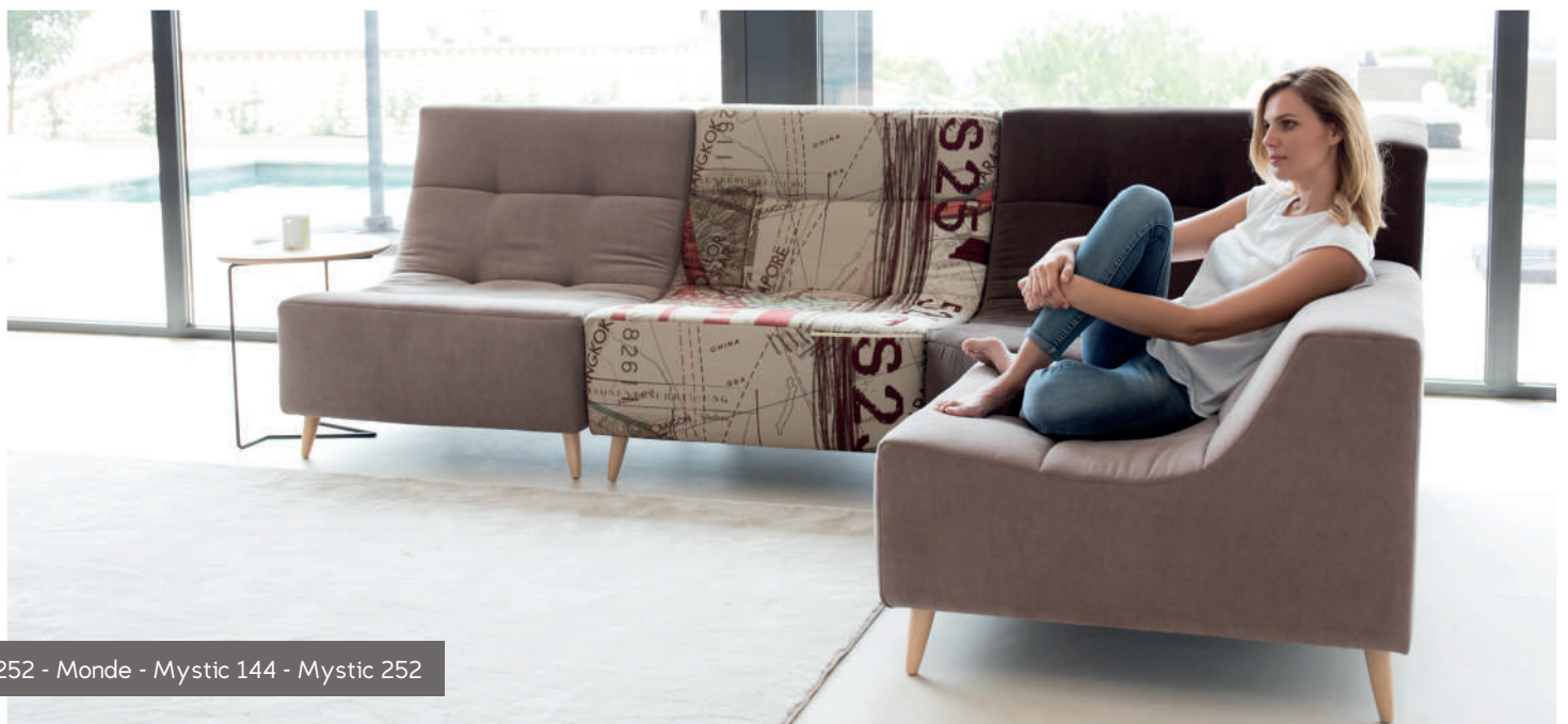
Mystic 252 - Monde - Mystic 144 - Mystic 252