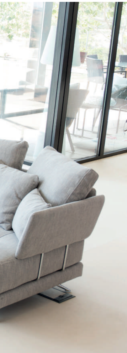
Club 12 Salonga 20 Maui 20