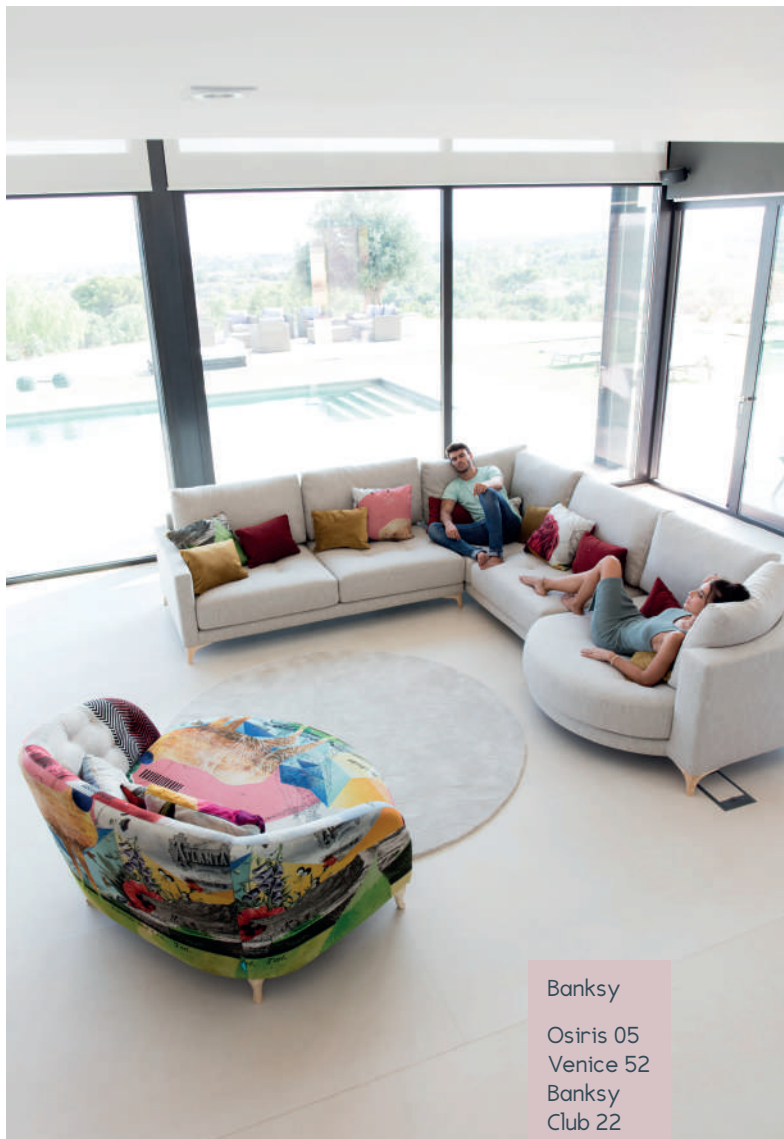
Banksy Osiris 05 Venice 52 Banksy Club 22