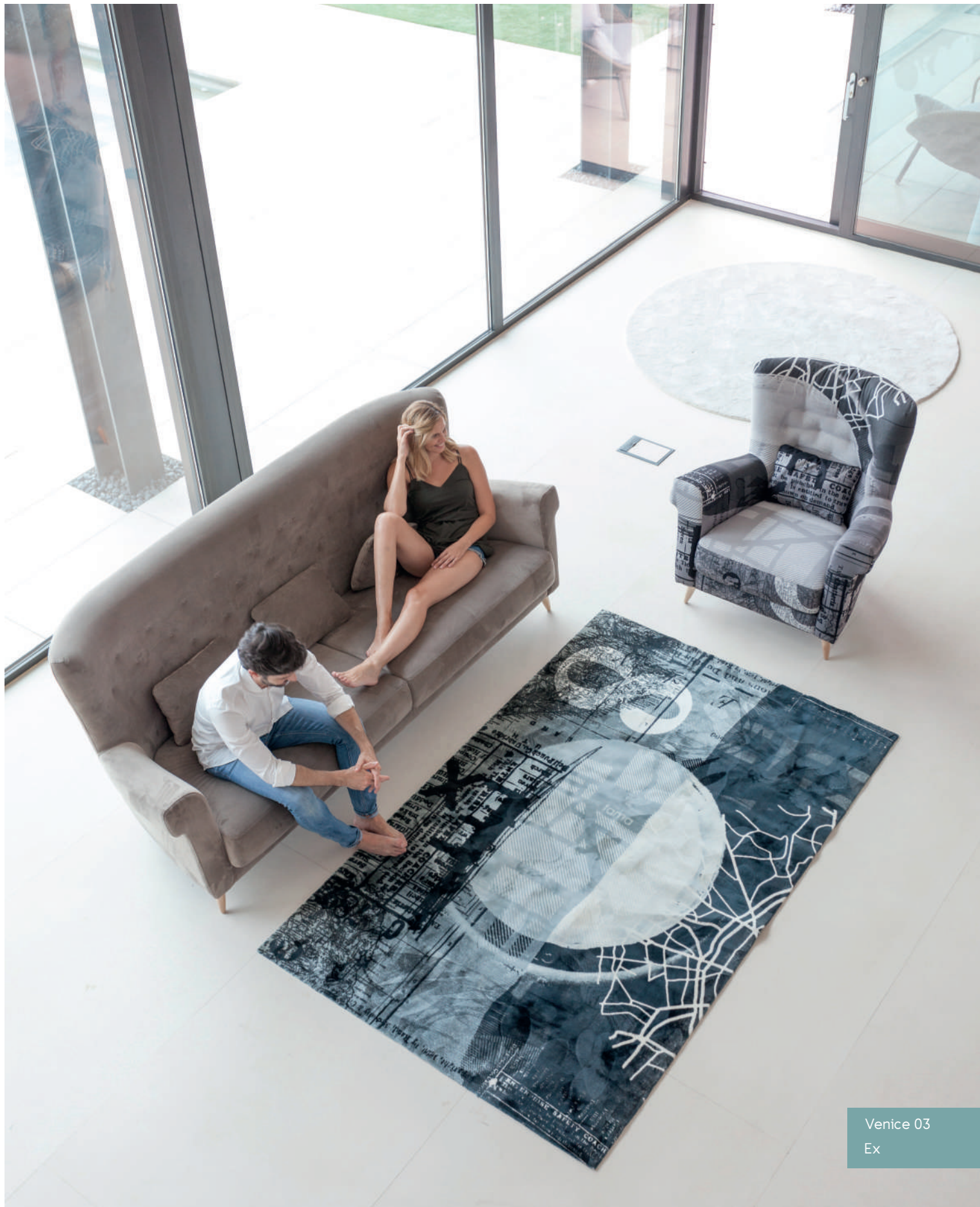
Venice 03 Ex