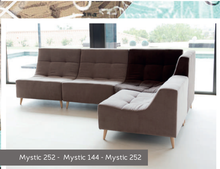
Mystic 252 - Mystic 144 - Mystic 252