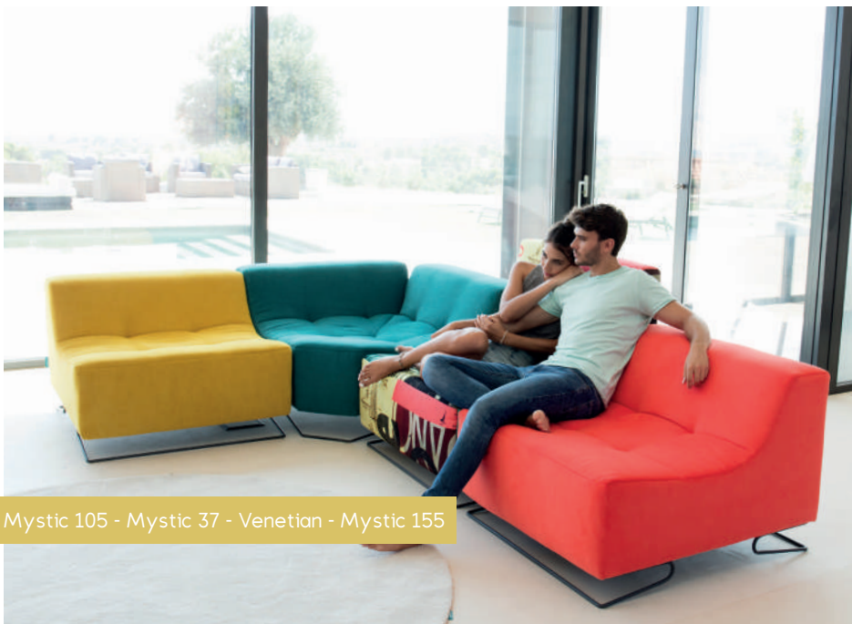
Mystic 105 - Mystic 37 - Venetian - Mystic 155