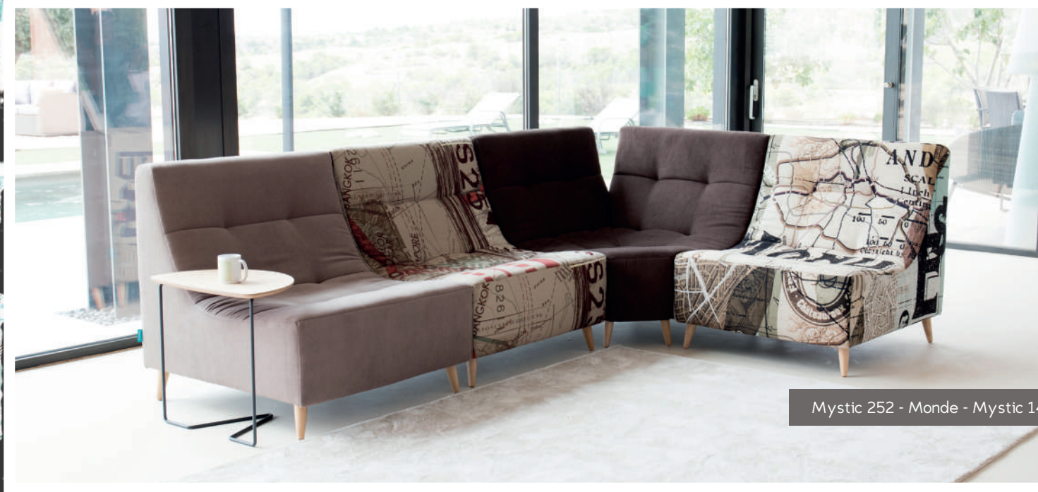
Mystic 252 - Monde - Mystic 144 - Maps