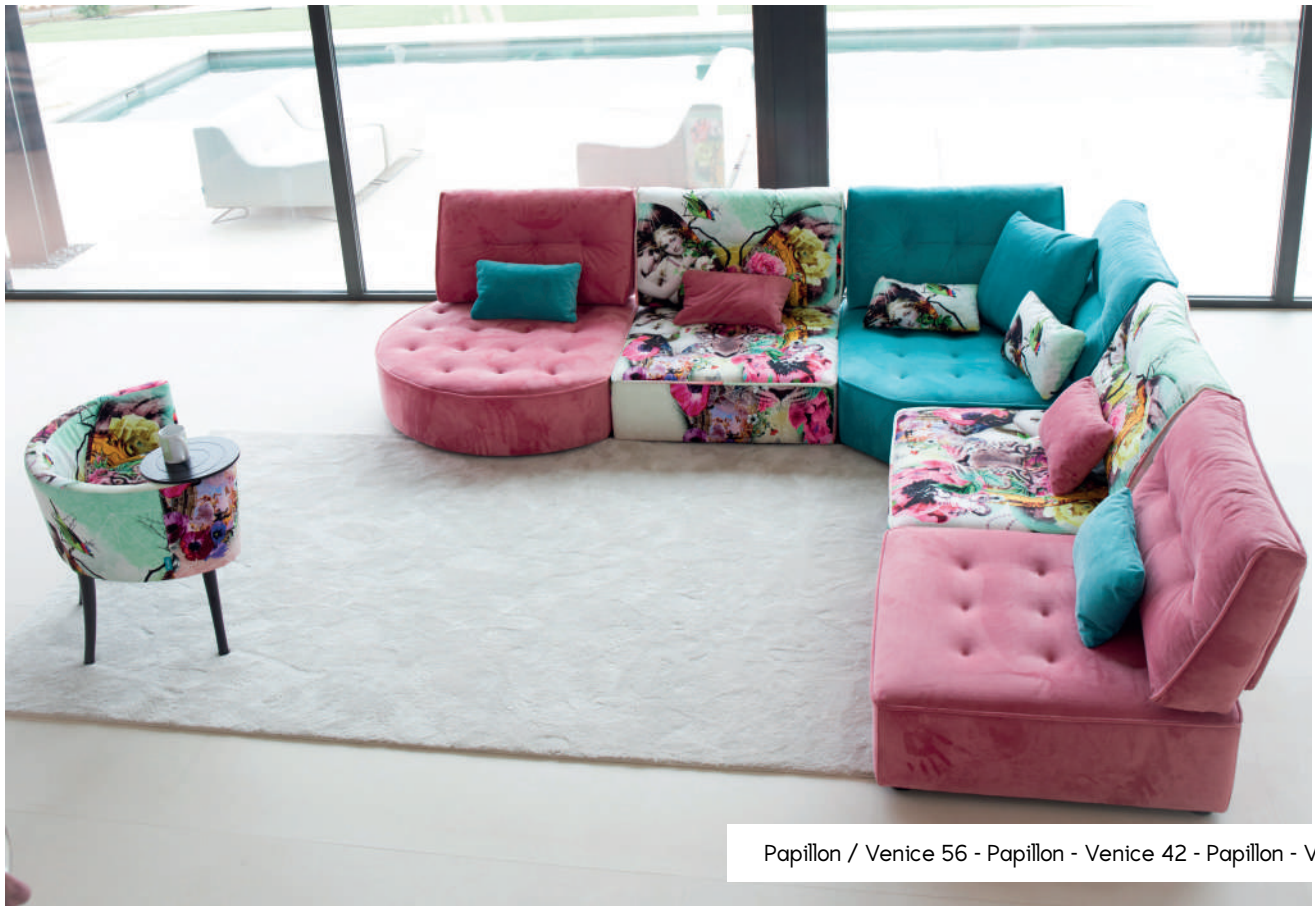
Papillon / Venice 56 - Papillon - Venice 42 - Papillon - Venice 56