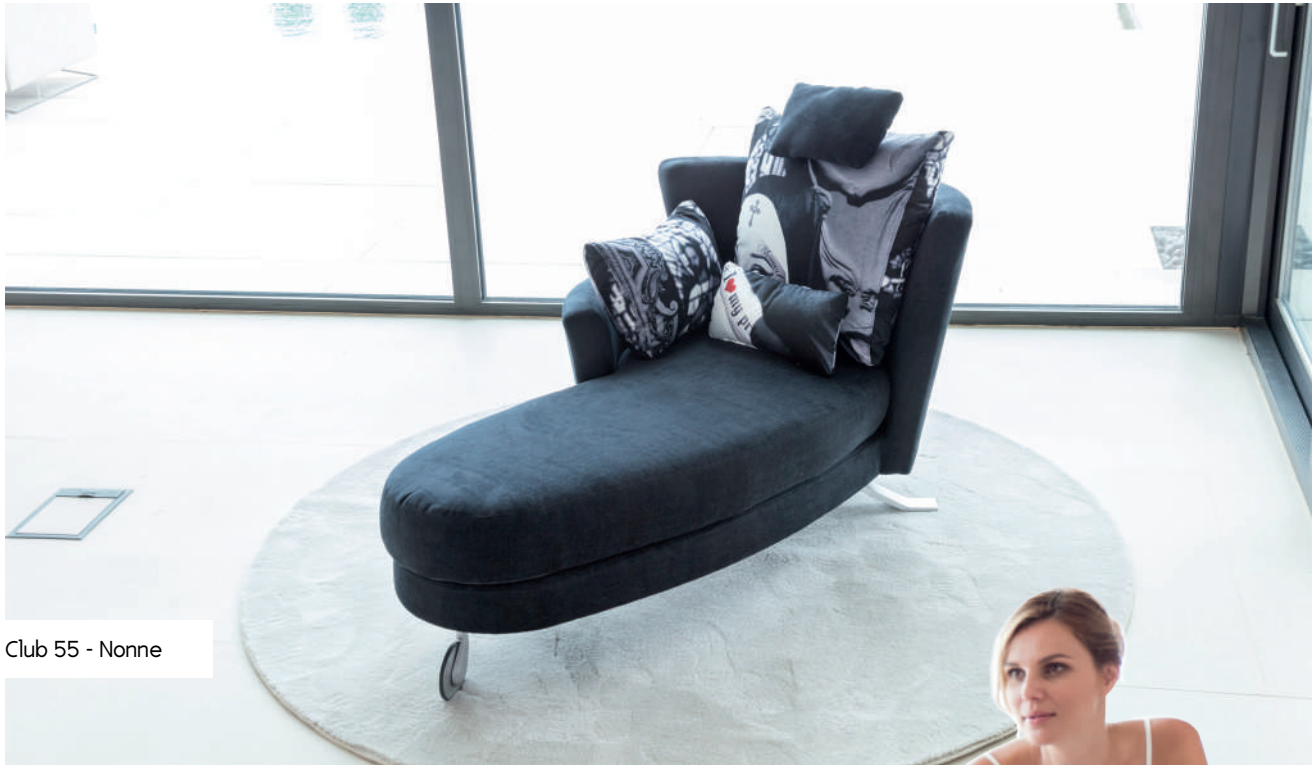
Club 55 - Nonne