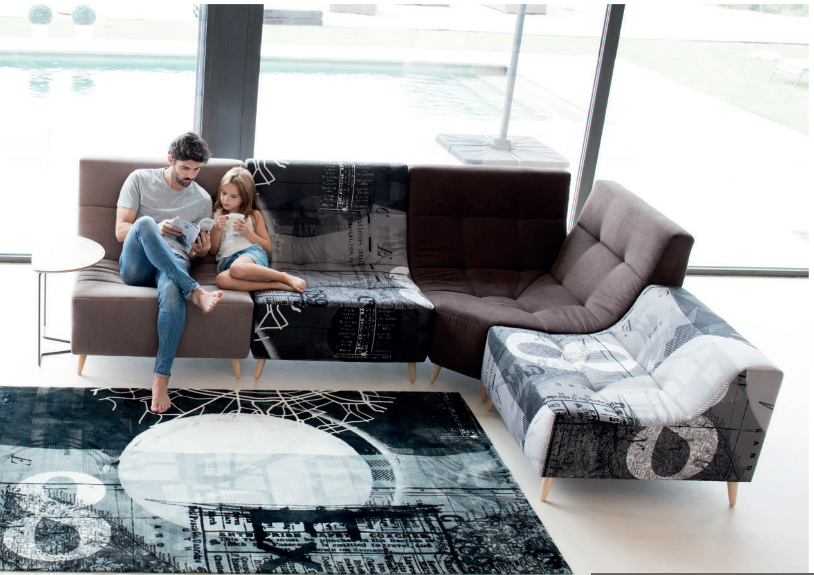
Ex / Mystic 252 - Ex - Mystic 144 - Ex