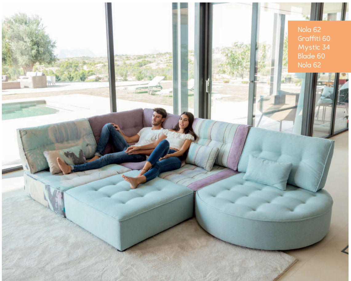
Nola 62 Graffiti 60 Mystic 34 Blade 60 Nola 62