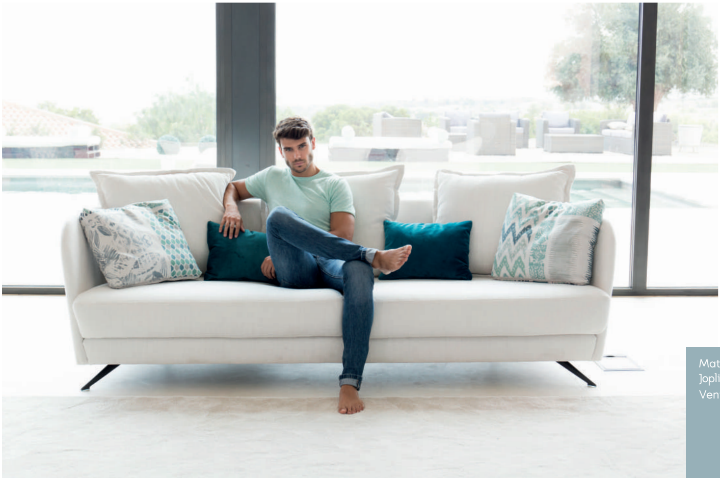
Matiss 05 Joplin 54 Venice 27