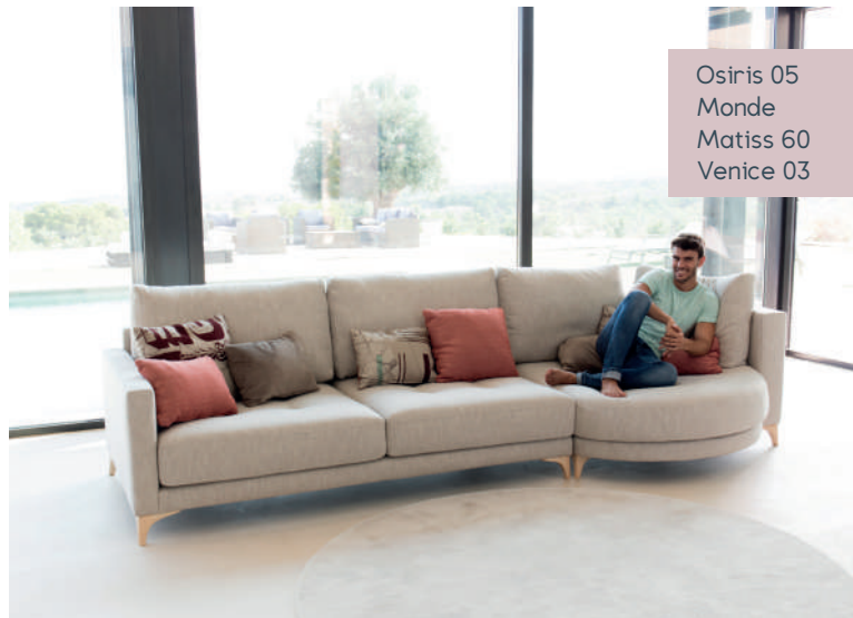
Osiris 05 Monde Matisse 60 Venice 03