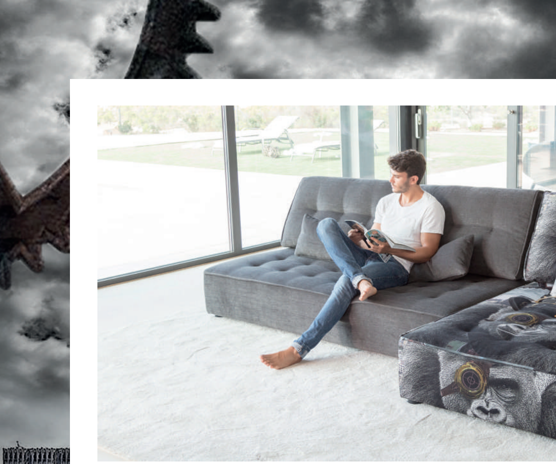
Club 53 - Gorilla