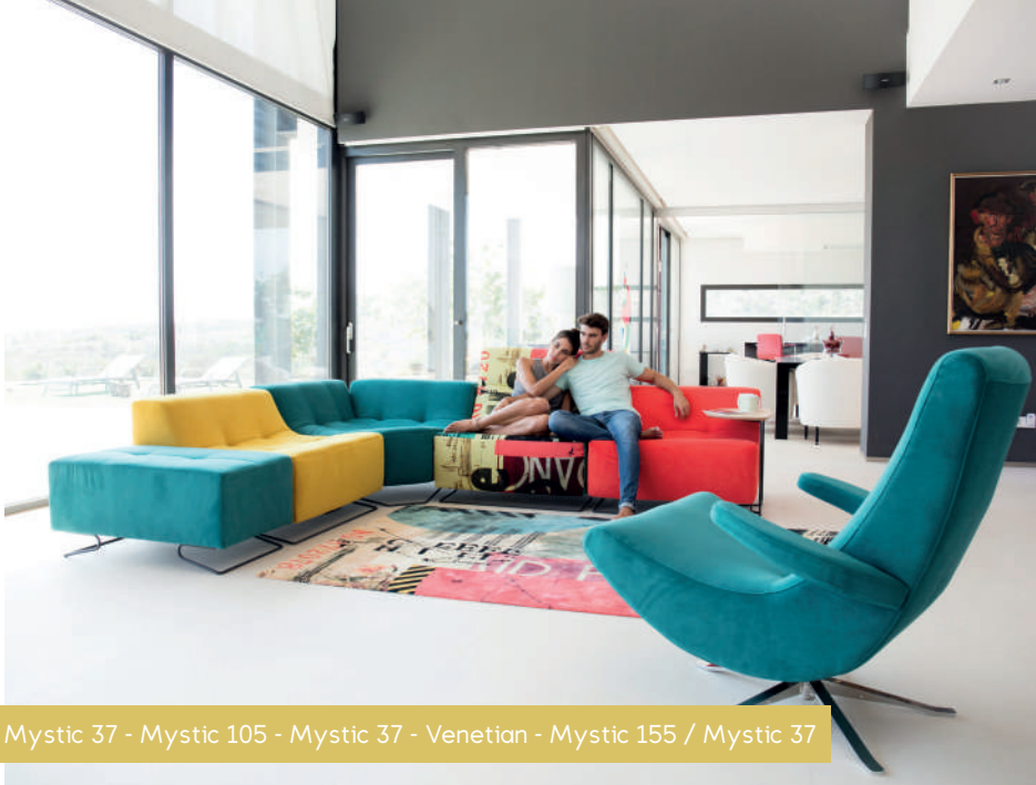
Mystic 37 - Mystic 105 - Mystic 37 - Venetian - Mystic 155 / Mystic 37