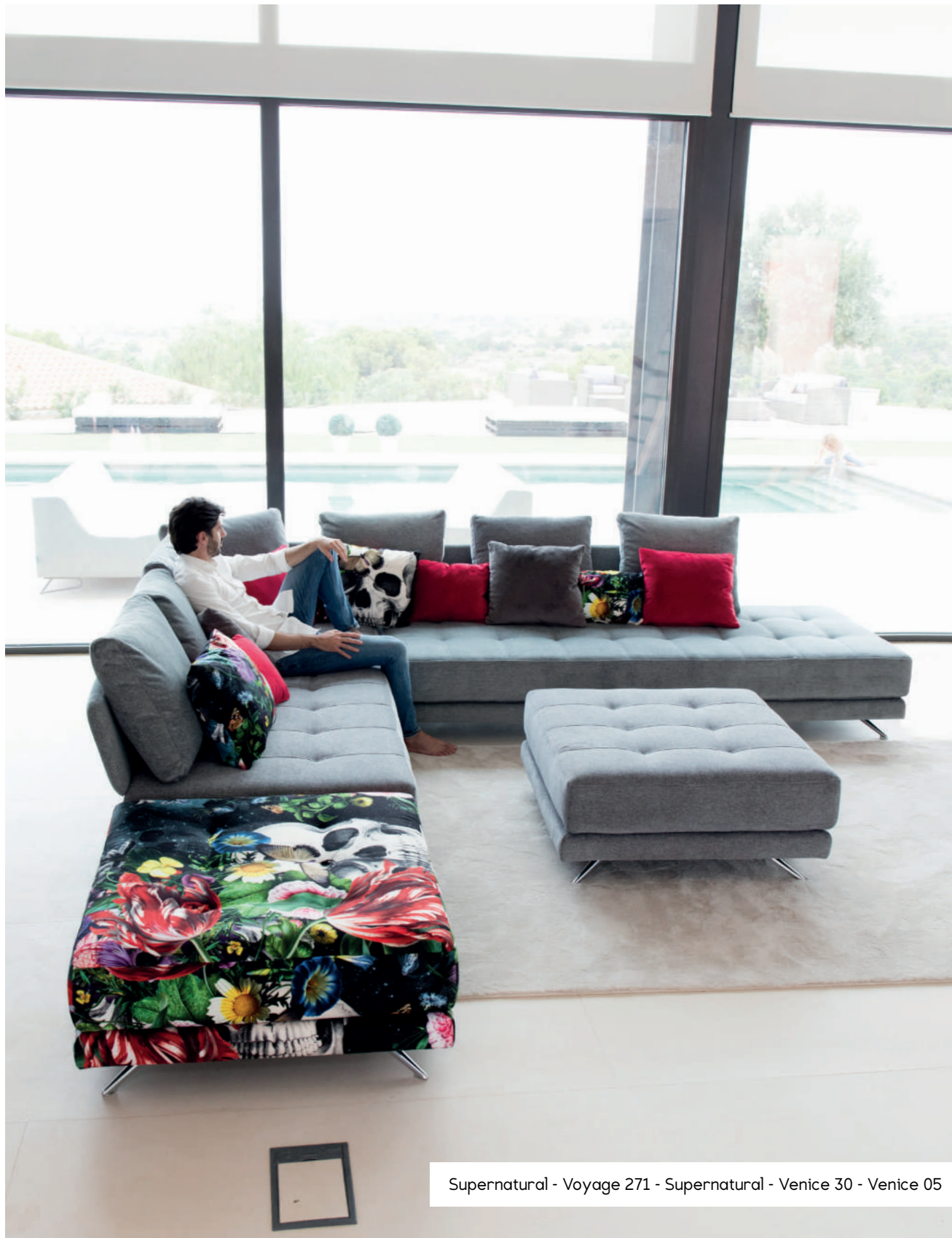
Supernatural - Voyage 271 - Supernatural - Venice 30 - Venice 05