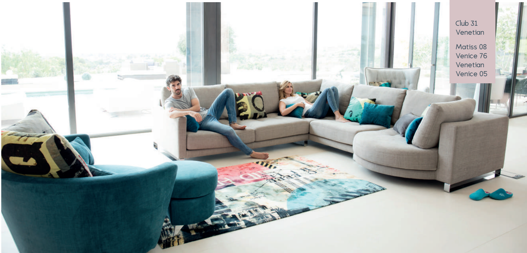
Club 31 Venetian Matisse 08 Venice 76 Venetian Venice 05